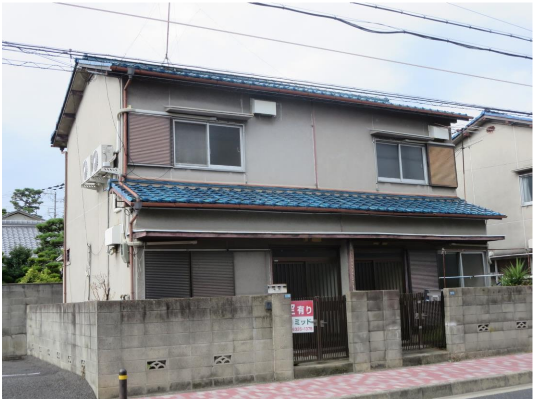
豊中市曾根西町2-17-7 * 阪急曾根駅から徒歩8分